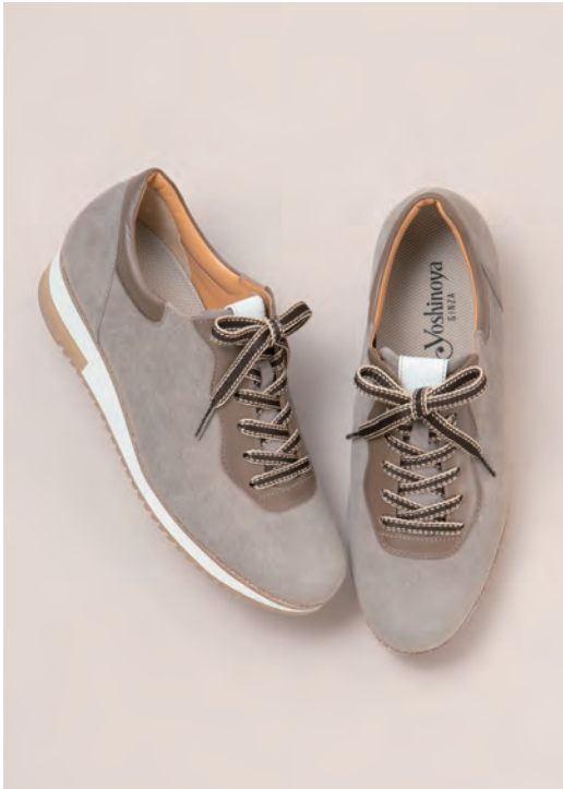
靴／税込40,700円 色=グレイージュ、チャコール、白 ヒール=3.5cm 足型=EW サイズ=21.5~24.5cm 品番=SH 64763