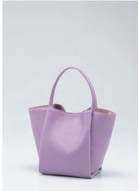
バッグ/税込26,400円 色=オーキッド、グレージュ、スモークブルー サイズ=H20×W28×D11cm 品番=ISI 90506