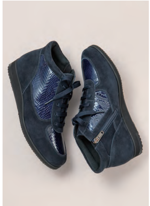
靴／税込38,500円 色=ネイビー、ライトベージュ、黒 ヒール=3cm 足型=EEW サイズ=21.0~25.5cm 品番=HF 23133