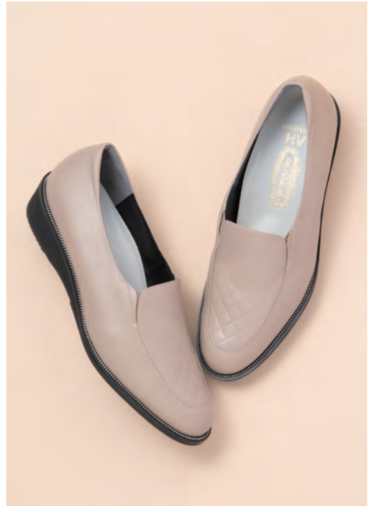
靴/税込37,400円 色=ベージュ、チタン、黒 ヒール=3cm 足型=EEV サイズ=21.0~25.0cm 品番=SH 64787-VG 外反母趾対応