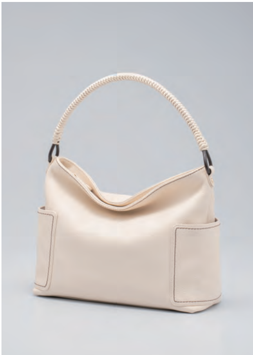
バッグ/税込37,400円 色=アイボリー、オーク、ブルーグレー サイズ=H26×W33×D12cm 品番=EMS 6272