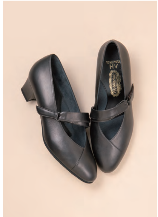
靴/税込39,600円 色=ブロンズ、ネイビー、黒 ヒール=4.5cm 足型=EEV サイズ=21.0~25.0cm 品番=SH 64790-VG 外反母趾対応 晴雨兼用 (10月上旬発売予定)