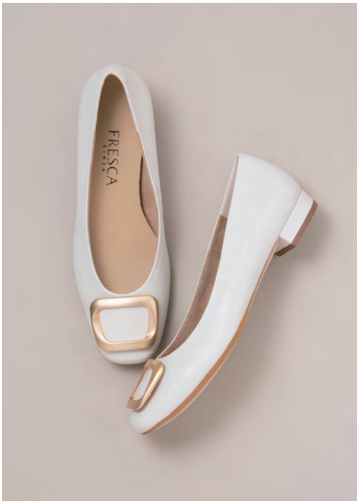
靴/税込27,500円 色=アイボリー、ガンメタ、モカ、黒 ヒール=2cm 足型=EW サイズ=22.0~24.5cm 品番=TOA 8664-FG