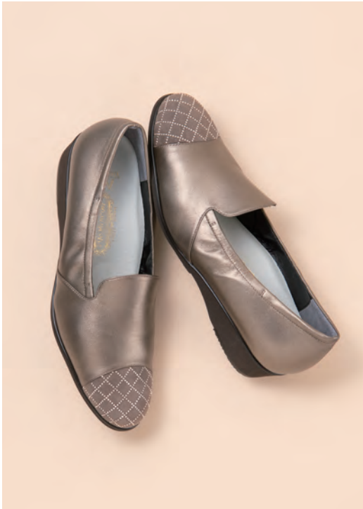
靴/税込37,400円 色=オーク、チタン、黒 ヒール=3cm 足型=EEV サイズ=21.0~25.0cm 品番=SH 64788-VG 外反母趾対応 晴雨兼用