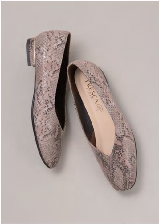
靴/税込25,300円 色=ブラウン、ダークパープル、黒 晴雨兼用 色=チタン ヒール=1.5cm 足型=EM サイズ=22.0~24.5cm 品番=RF 7965-FG