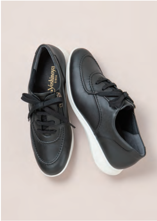
靴／税込30,800円 色=黒、キャメル、グリーン、ダークグレー ヒール=3.5cm 足型=EEW サイズ=21.5~25.0cm 品番=HF 23126