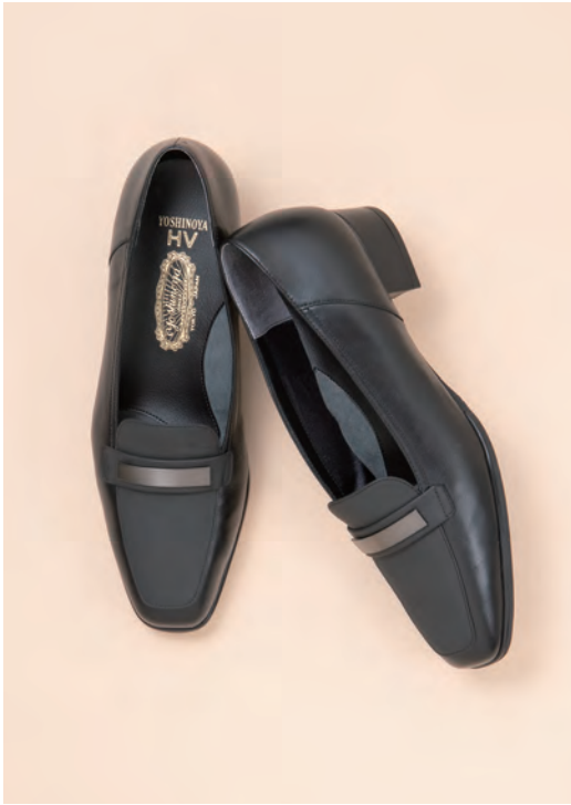
靴/税込39,600円 色=黒、アイアンブルー、ブロンズ ヒール=3cm 足型=EV サイズ=21.0~25.0cm 品番=SH 64789-VG 外反母趾対応