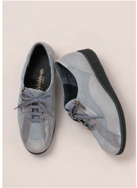
靴／税込37,400円 色=ライトグレー、ローズグレー、黒 ヒール=3cm 足型=EEW サイズ=21.0~25.5cm 品番=HF 23140