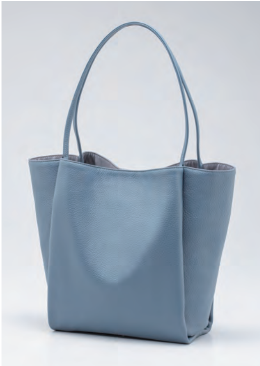
バッグ/税込31,900円 色=スモークブルー、チタン、黒 サイズ=H30×W37×D12cm 品番=ISI 90507