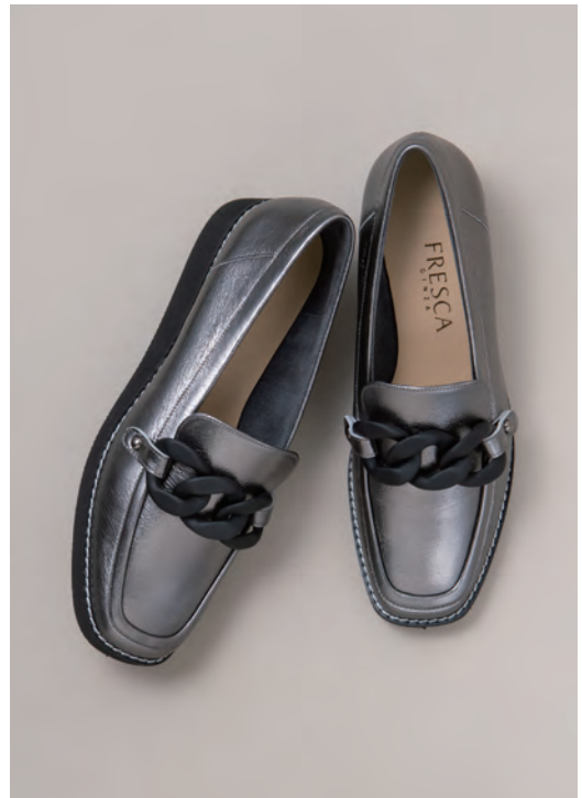
靴/税込28,600円 色=ガンメタ、黒、白 ヒール=3.5cm 足型=EW サイズ=22.0~24.5cm 品番=TOA 8665-FG