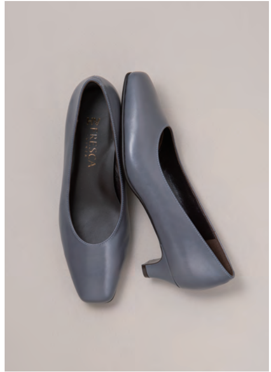
靴/税込25,300円 色=ブルーグレー、オーク、黒 ヒール=4cm 足型=EV サイズ=22.0~24.5cm 品番=RF 7966-FGV