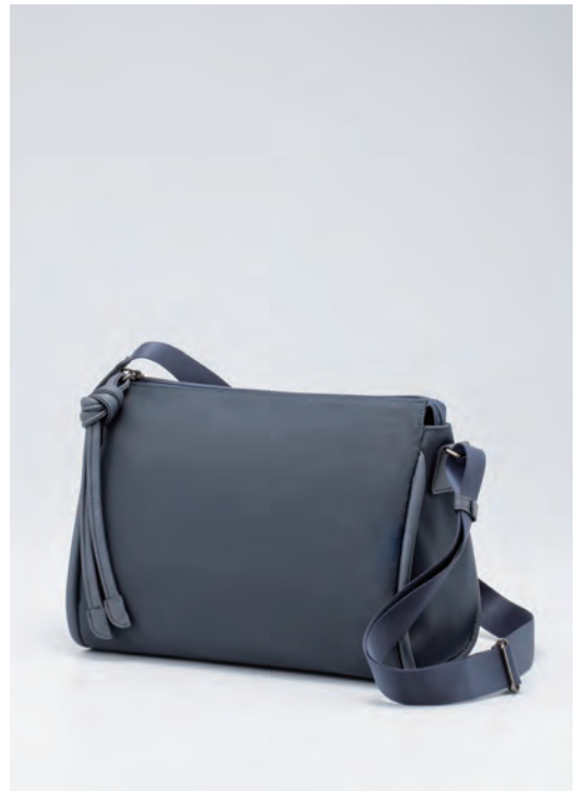
バッグ/税込23,100円 色=ネイビー、プラム、黒 サイズ=H21×W30×D14cm 品番=STF 60525